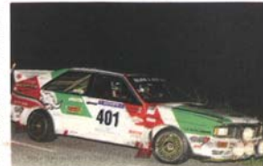
Il Rally Circuito di Cremona ha dato il via alla sperimentazione della categoria Auto Storiche: entrerà in vigore dal 2013 e potranno prendere il via anche le Gruppo B come la Audi Quattro