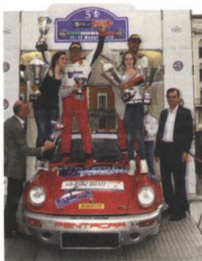
Da Zanche e Bellone sul podio della 1000 Miglia

manca di continuità semplicemente non riescono a tenere il ritmo di vertice per tutto l'arco temporale delle gare. E che per questo vanno a posizionarsi immediatamente alle loro spalle. È il caso di Marco Demiseni, di