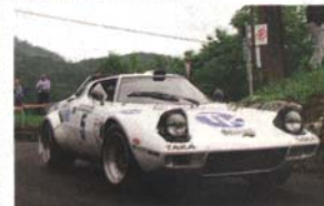
Giorgio Costenaro, attualmente non in classifica generale